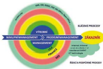
Obr. 1 Podporované procesy

Modularita umožňuje výběr pouze těch částí, které podporují Vaše procesy. Klademe důraz na prodejní a nákupní management (CRM, SCM), výrobní management (včetně plánování MRP I, MRP II, APS), manažerské řízení (MIS) a řízení financí .